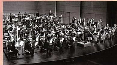
富山シティフィルハーモニー管弦楽団